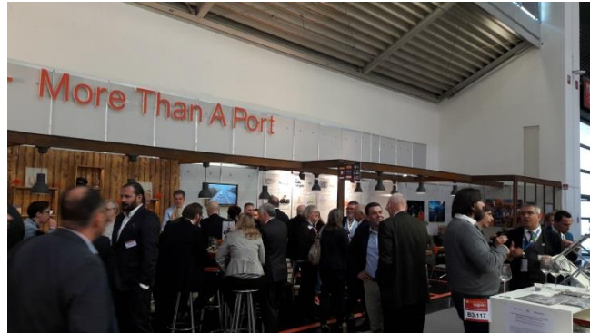
Gemeinschaftsstand Lübecker Hafen „More Than a Port“